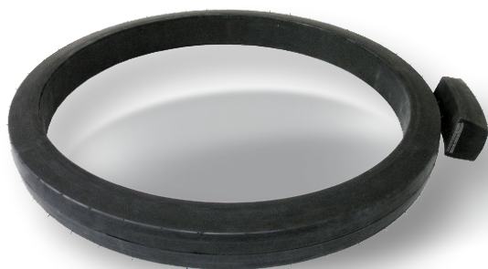
Gumová obruč odkorňovacího bubnu Rubber solid tyre 750/75-640 for debarking drums

Výrobky lisujeme ve formě v etážovém vulkanizačním lisu 400x400 nebo 800x800 mm. We have semi-automatic presses 400x400 and 800x800 mm.