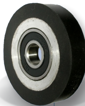
Pogumovaná kladka z oděruvzdorně směsi Rubberized pulley made of abrasion resistant blend